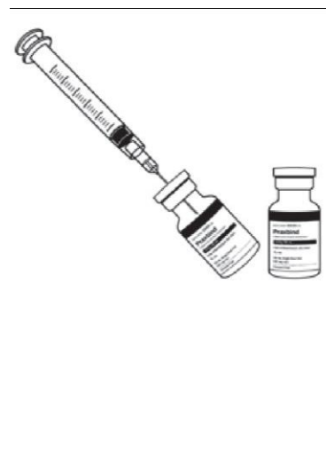
Figura 3 – Injete os dois frascos consecutivamente através da seringa.

PRAXBIND não deve ser misturado com outros medicamentos. Um acesso intravenoso preexistente pode ser utilizado para a administração de PRAXBIND. Ele deve ser lavado com solução de cloreto de sódio 0,9% antes e ao final da infusão de PRAXBIND. Não se deve utilizar o mesmo acesso intravenoso para administrar paralelamente nenhuma outra substância.