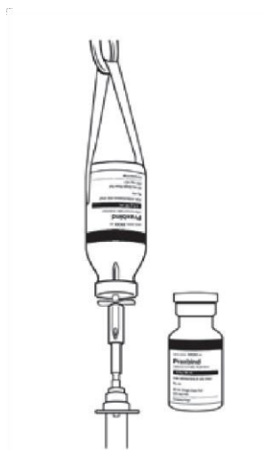
Figura 2 – Duas infusões consecutivas por frascos suspensos.