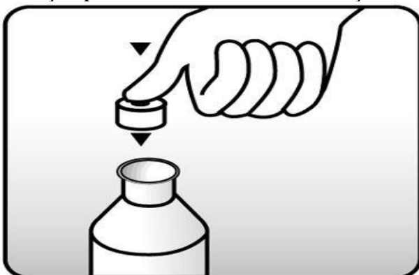
Fig. 1: coloque a tampa com orifício (batoque) no frasco.