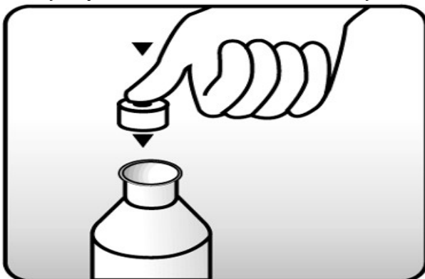
Fig. 1: coloque a tampa com orifício (batoque) no frasco.