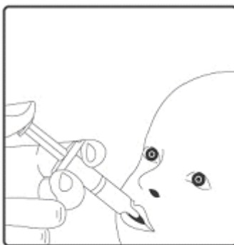
2. Esta vacina destina-se apenas à administração oral. A criança deve estar sentada em posição reclinada. Administrar por via oral (isto é, na boca da criança, na parte interna da bochecha) todo o conteúdo do aplicador oral.