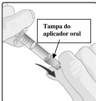
1. Remover a tampa protetora do aplicador oral.

Instruções para administração da vacina com o aplicador oral: